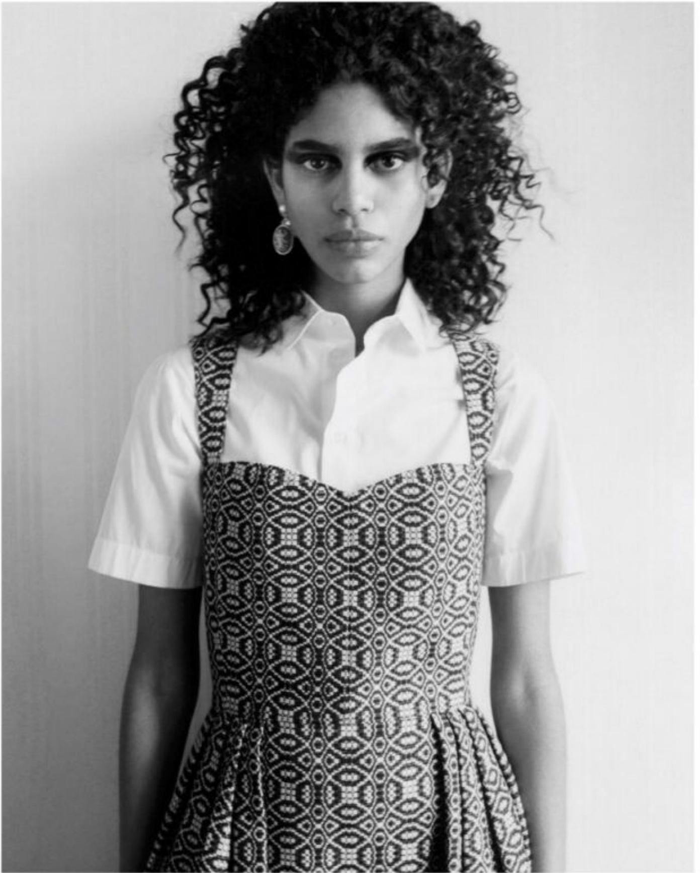
Jurk met franje van Le Constantine-stof, katoren blouse, metalen oorbel met gouden afwerking, witte zoetwaterparel en rood kunstbars 'Dior Tribales', alle Dior HUID: Dior Prestige la Micro Huile de Rose Advanced Serum, BASIS: Dior Forever Skin Correct in kleur 4N Neutral, OGEN: mascara Diorsbow Iconic Overcurl in kleur 694 Brown, op de oogleden Diorsbow kholpodlood in kleur 099 Black Khol LIPPEN: Lip Maximizer in kleur 013 Beige, PARFUM: Fève Délicieuse